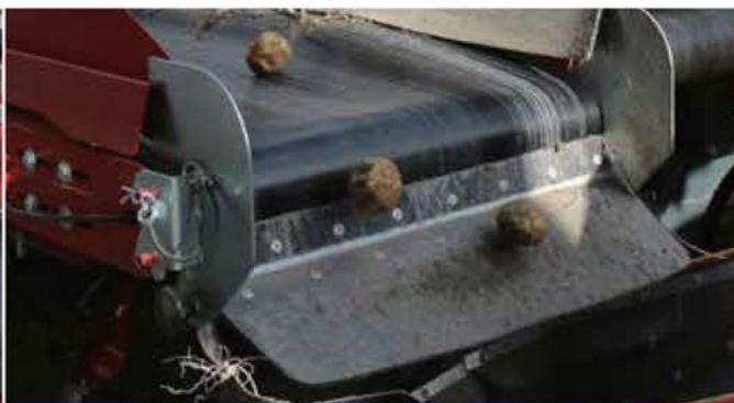
DISCHARGE CONVEYORS WITH TRACKING BELTS