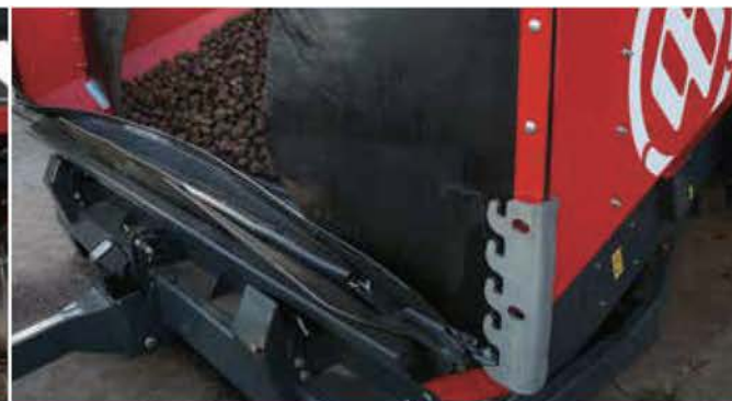
VARIABLE INTAKE BOARD 可変取り入れ口ボード

スパイラルローラの間で動くスマート - ピンの耐摩耗性の特質のおかげで貯蔵プロセスのどぎれず安定したプロダクトクリーニングの品質が確保されます。あなたがより厳しい条件に対応するとき、セカンドピンを追加できます。さらに、茎の付着の防止のために、格納式のスマート - ピンもあります。