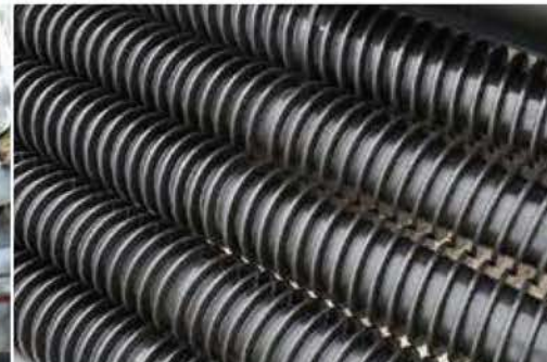
PU ROLLERS PUローラー

スパイラルローラーは、様々なタイプの土質や石が多い区域でさえも、適応します。それらの閉じられたデザインで、茎がローラーにまわりつかず、最も良いクリーニングを提供します。スマートピンとの組み合わせで、さらに中断することなく、常に効率よくきれいにすることができます。