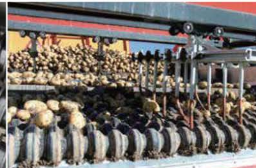
SU GRADING ROLLERS SU等級付けローラー

7本又は11本のスタッドのついたポリウレタン星状ローラーを代わりに利用可能です。これらは軽い質の土を処理することに適しています。これらは十分プロダクトにやさしくて効率的なクリーニングを保証します。