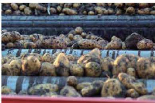
SMOOTH ROLLERS スムースローラー

スムースローラーは重い質の土を処理するのに適しています。特に過酷な状況で、スクレーパーで土が固まってローラーが固着しないようにします。それらはスパイラルローラーとも組み合わせられすべてのローラーは素早く、容易に交換可能です。