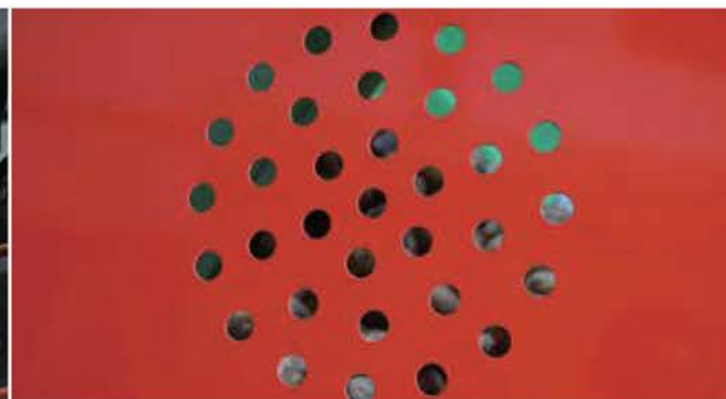
EASE OF USE