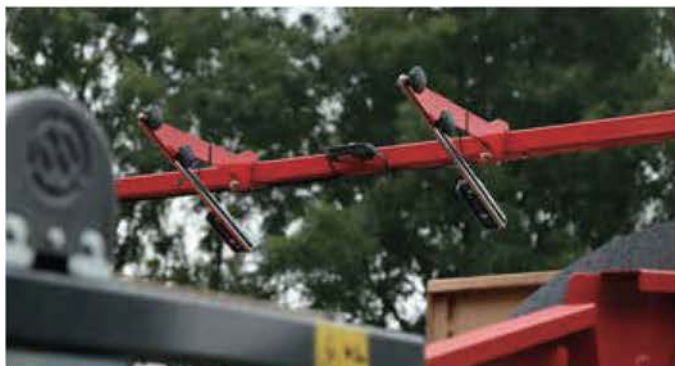
SB-CONTROL AND MH-CONTROL SB&MH コントロール

さらに処理能力を上げるバンカーフロアのスピードをコントロールするために2つのセンサーが使われます。プロダクトの連続排出のために、あなたの貯蔵ラインの各マシンは手動での調整は必要なく、最適に満たされます。これは最高にプロダクトフレンドリーな証明です。