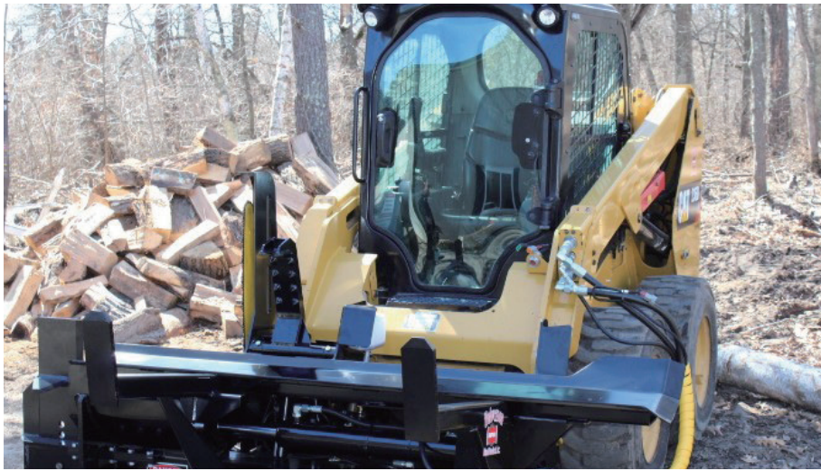
HWP-120 / HWP-140B HD